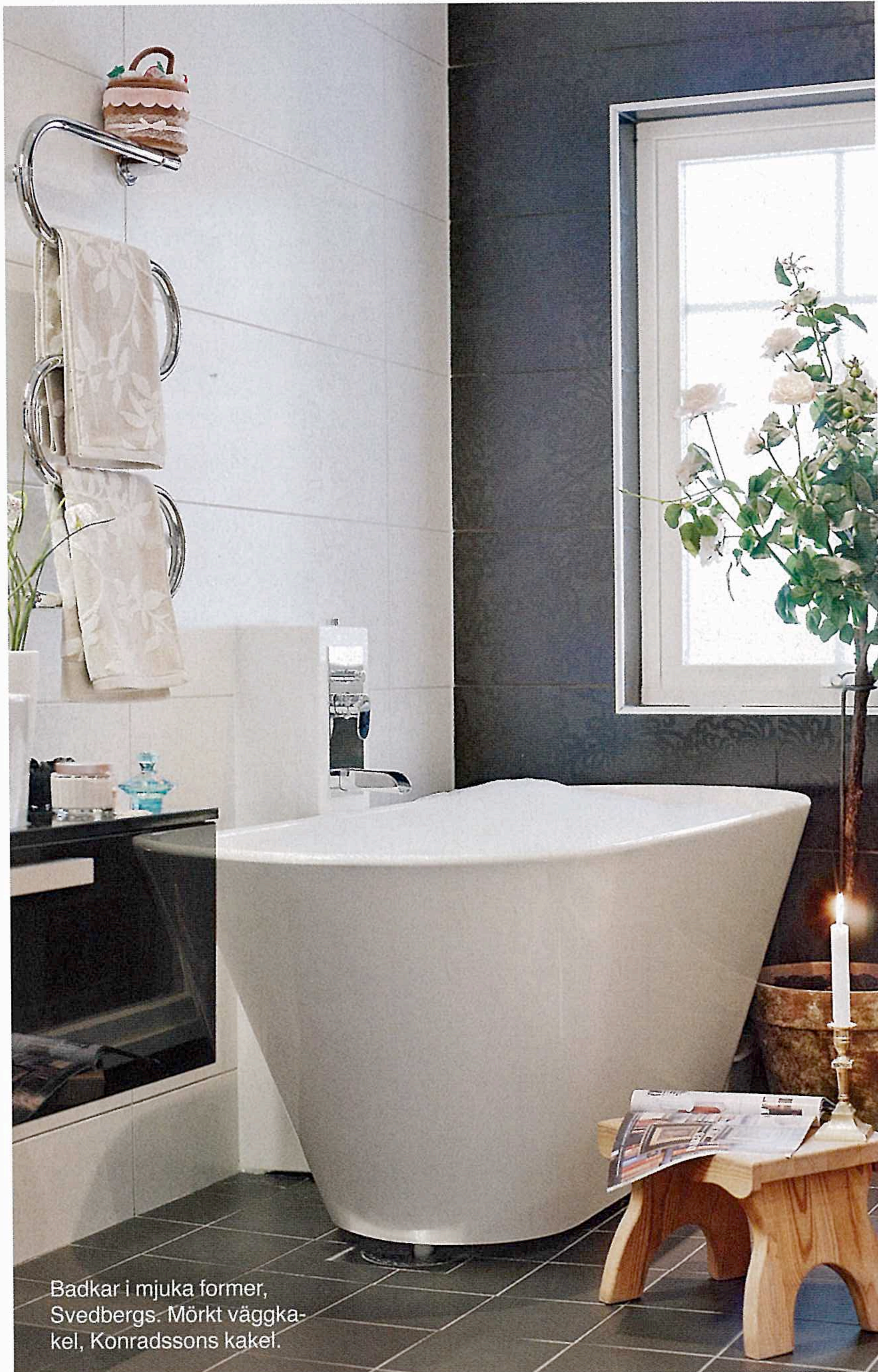
Badkar i mjuka former, Svedbergs. Mörkt väggkakel, Konradssons kakel.

Den maffiga vattenfallsblandaren låter vattnet rinna brett och mjukt, Svedbergs. Det svagt blommönstrade kaklet, Konradssons kakel.